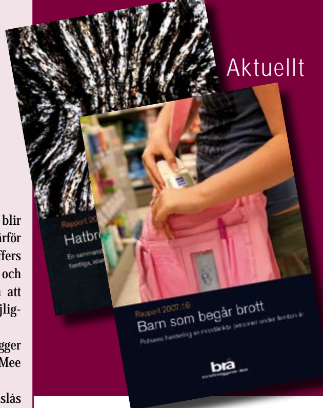
Två nya rapporter från Brå: Barn som begår brott och Hatbrott 2006.

Nordisk Tidsskrift for Kriminalvidenskab utges av de nordiska föreningarna. Den kommer med fyra nummer per år och innehåller presentationer av aktuell forskning och utredningar, diskussioner kring lagstiftning samt kronikor.