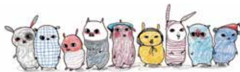
Illustration från barnboken Liten av Stina Wirsén som tagits fram i samband med webbplatsen Jag vill veta. Nu arbetar Brottsoffermyndigheten även med att ta fram en handledning som stöd till förskolepersonal.