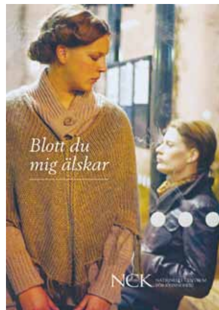
Filmen Blott du mig älskar är framtagen av Nationellt centrum för kvinnofrid. Den är en av två filmer om våld i samkönade parrelationer som har premiär i maj.

Fyra nyanser av våld har tagits fram inom ramen för det EU-finansierade projektet LARS (Lesbian Awareness Raising Strategies) som RFSL:s brottsofferjour deltar i. Filmen har utarbetats utifrån en workshop som tidigare hållits under Pridefestivalen och på utbildningar i