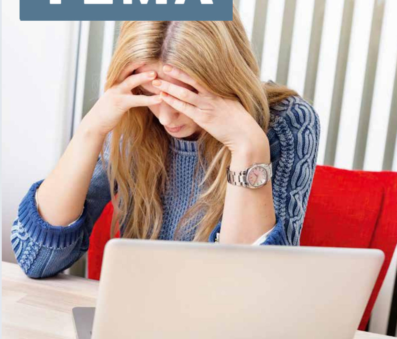
PERSONEN PÅ BILDEN HAR INGEN KOPPLING TILL TIDNINGENS INNEHÅLL