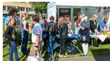
Brottsofferjouren Uppsala delade ut godis och armband till ungdomar på festival.